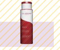
CLARINS ボディ フィット