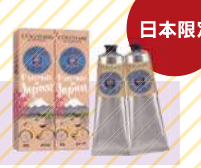
L'OCCITANE シアハンドクリーム