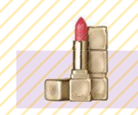
GUERLAIN キスミス マット