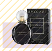
BVLGARI ゴルデア ローマナイト EDP