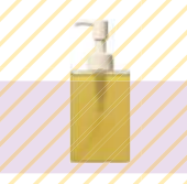
THREE パンシング クレンジング オイル