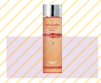
Dr. Ci:Labo ラボラボ スーパー毛穴ローション