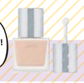
RMK クリームフィアソーション