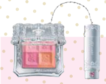
JILLSTUART ミックスブラッシュコンパクト